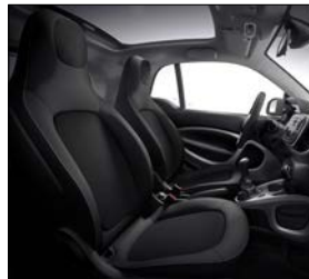
黑色織布 (代碼 07U)