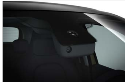
雨滴感應式雨刷與自動啟閉頭燈 (代碼 V54)