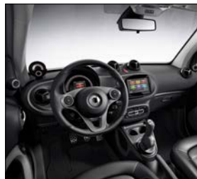
黑灰雙色內裝 (代碼 56U)