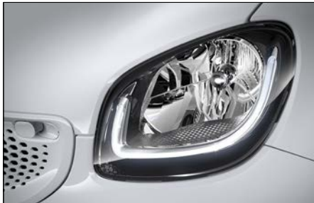
鹵素頭燈附 LED 日行燈 (代碼 K32)